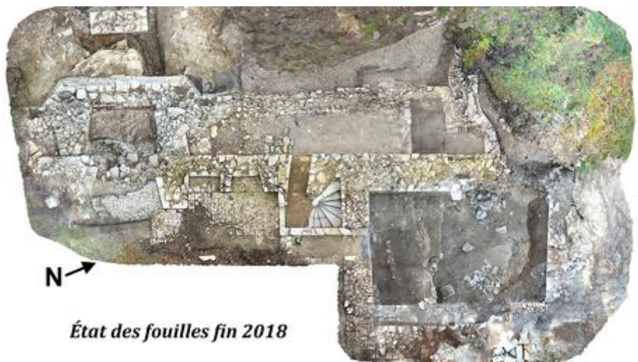
État des fouilles fin 2018

En 2018 est réalisé le dégagement de la salle nord et d'une cave voûtée : une datation au carbone 14 de 2 planchers les situe entre 1300-1369 et 1164-1265.